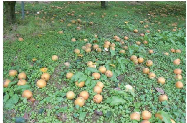
地震直後のなし園地