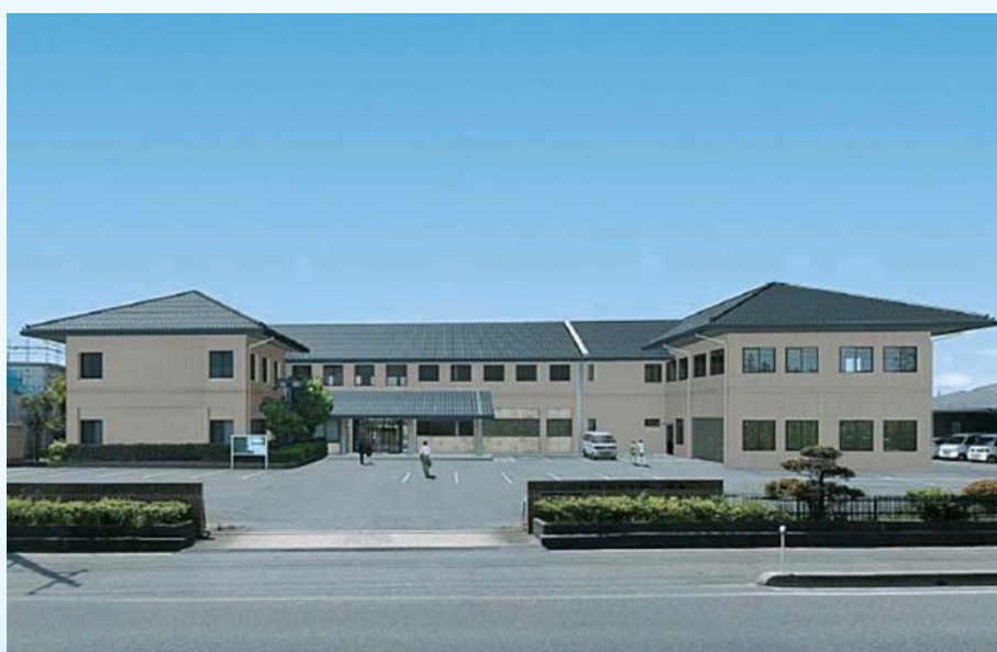
完成予定図（向かって右が本所、左は現中部支所）