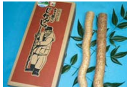
※景品は写真と若干異なります。