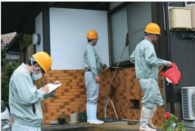
被害確認をする損害評価班

10月25日に損害評価研修会を開催。損害評価眼と損害評価基準の統一を図り、「建物共済中国地区損害評価技術研修会」を履修した職員を各班のリーダーとし、中部・本所・他の支所の職員を振り分け、10月26日から4人1組10班集体で損害評価に取り組んだ。