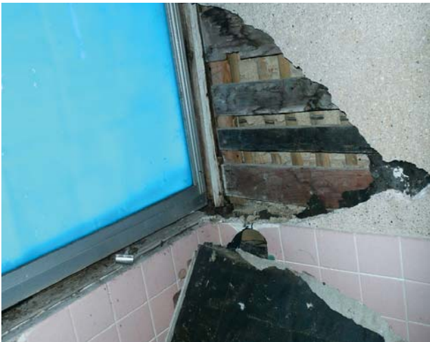
浴室の壁、タイル落ち