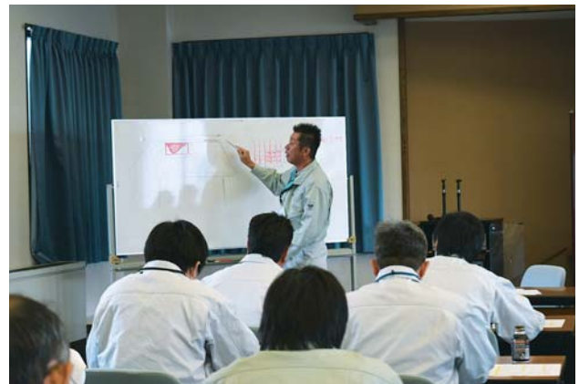
損害評価研修会で評価基準の統一