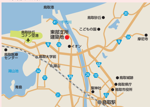
鳥取市賀露町4074番地