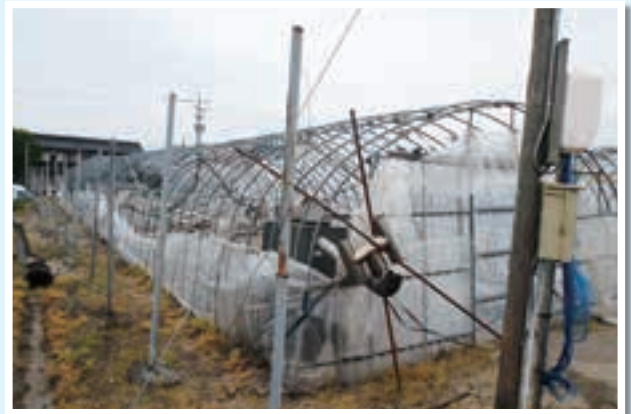
被覆材と附帯施設への被害