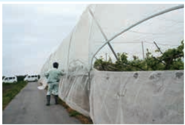
多目的ネットの側面破れ