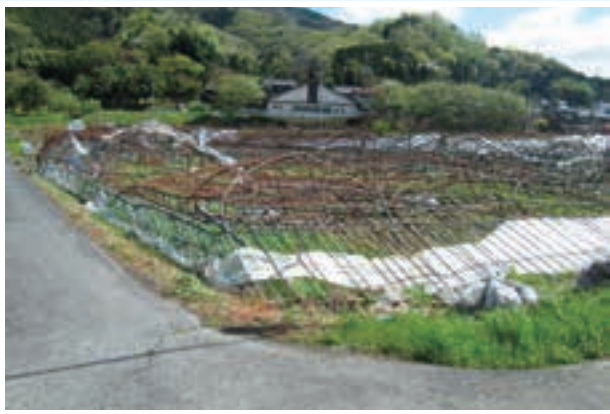
連棟ハウス(全損被害)