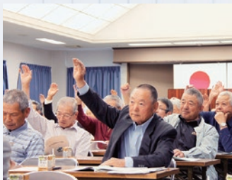
多くの賛同を得て可決