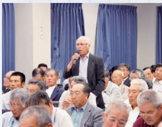
積極的な質疑応答