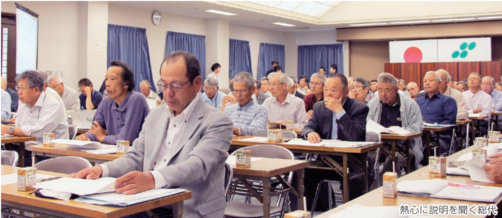
熱心に説明を聞く総代