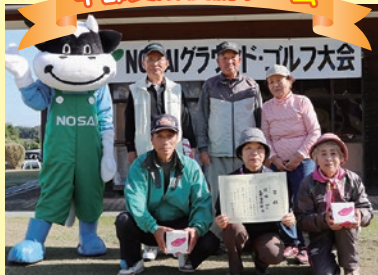
大栄栄南部チームの皆さん