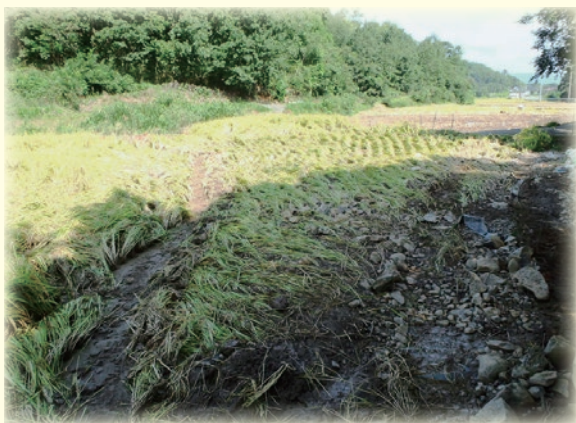
台風18号による土砂流入

田植期から出穂期までは、ほぼ順調に経過しましたが、9月17日、18日の台風18号によって、倒伏、冠水などの風水害が発生しました。また、以前は山間部で発生していた獣害が、里部においても発生しています。その他では飼料用米の一部で病害(ごま葉枯病)も発生しました。