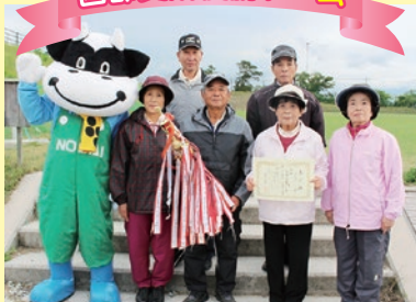
大山カラス天狗平Aの皆さん